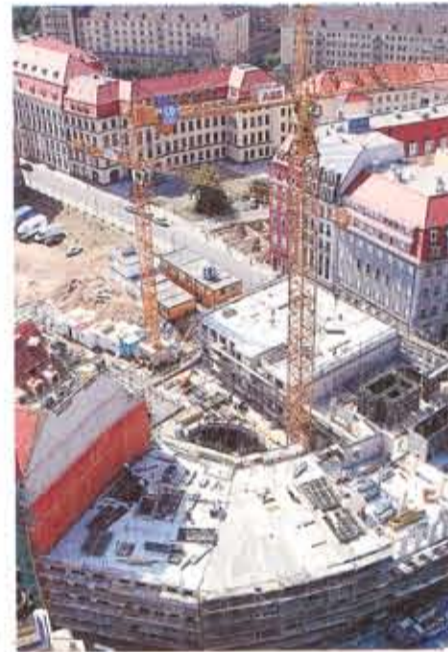
Blick von der Frauenkirche auf das Quartier III. Im Mai/Juni 2008 soll es fertig sein.

sieht Dietze als ihr „Baby, das die Baywobau gegen den Widerstand vieler Boboren (d.h. in die Öffentlichkeit gebracht und dafür eine Lobby aufgebaut) hat“. Dietze findet, „dass dieses geschichtsträchtige Gebäude, auch wenn es aufgrund der Woba-Bebauung nur zum Teil wieder errichtet werden kann, ein Muss für den Neumarkt ist.“ Catrin Steinbach