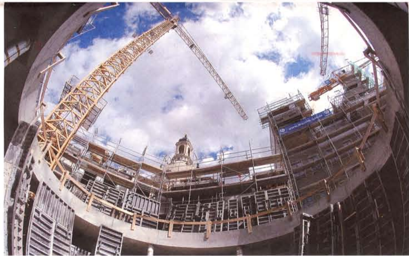
Durch die Glaskuppel, die künftig den Innenhof im Quartier III überdachen wird, kann man auf die Kuppel der Frauenkirche blicken.