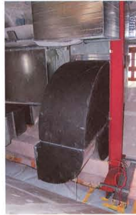
Das Belüftungssystem schickt rund um die Uhr frische Luft in drei verschiedene Etagen.

„Die schmale Bauweise der Gebäude an der Frauenkirche war die größte Herausforderung bei der Planung der Anlage“, erläutert Uwe Bartsch von der IGL. Nach Angaben des Unternehmens musste die umfangreiche Installation auf möglichst geringem Raum untergebracht werden. Das Belüftungssystem, das aus zwei Einzelanlagen besteht, versorgt die Gasträume und Küche mit frischer Luft vom Kellergeschoss bis ins 1. Obergeschoss. an-ne